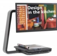
クリアビューC HD 22