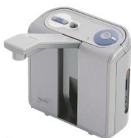
クリアリーダープラス