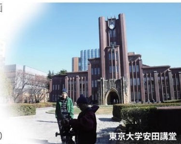
東京大学安田講堂

作品の中に登場する資料には、現存する2冊のみの「私宅監置」報告書(1冊は岡田先生の手元に、もう1冊は国会図書館!)、呉秀三の初めての著作の初版本、家族にあて欧州から送った絵葉書(既に所在不明!?)、秘蔵されていた数枚の写真(東大医学図書館に保管)などがある。日本で初公開! 呉秀三の欧州留学先での足跡——彼が1900年前後に留学・視察したベルギーとオーストリア(ウィーン大学)に残されている「自筆の署名」を求めて海外ロケを敢行し、彼の下宿アパートもカメラに収めてきた。