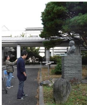
松沢病院の呉秀三胸像

呉秀三(くれしゅうぞう)は、今から百年前の時代に東京大学医学部精神科の教授として、異例の社会的な取組みを進めた先達者である。彼は精神疾患の人々が「座敷牢」に押し込まれる実情を憂い、その解決のために奔走した。その土台となった報告書『精神病患者私宅監置ノ実況及ビ其統計的観察』を1918年に提起し、多方面へ働きかけた。それから1世紀の年月が過ぎた今、精神障害者の問題はどのようなのだろうか？