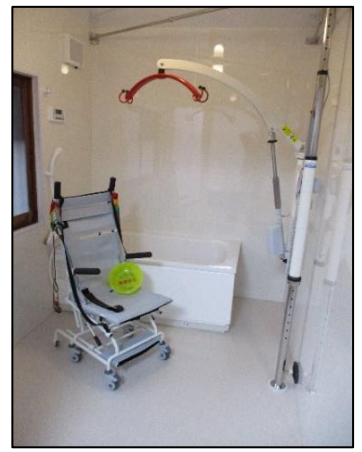
家庭的な雰囲気です。ゆっくり （ゆったり）入れる浴室です。 （毎週月、水、金 週3回利用可）