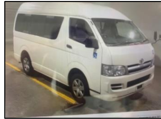
くるま すわ の 車いすに座ったまま乗れるリフトカーで可能な限り 自宅付近まで送迎します。（月～金 毎日利用可）