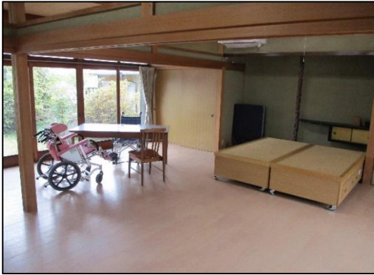
大きな窓で太陽の光がたくさん入る 活動スペース（作業室 訓練室）です。