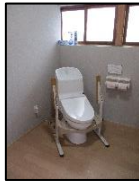
てあら お手洗 いです。