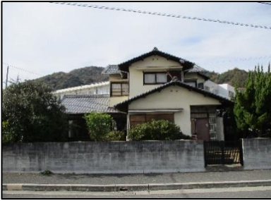
おおの がくえん せいもん 大野学園（正門） すぐ前の古民家です。