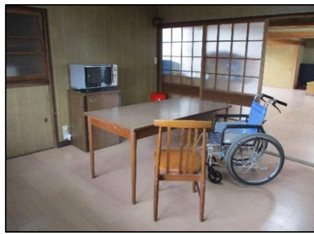
ゆっくりお話しなども出来る 相談室（多目的室）です。