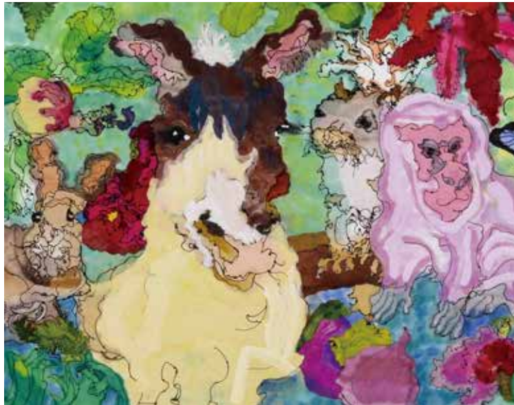
令和2年度 広島県知事賞 「八天堂のなかまたち」 鬼頭 純平