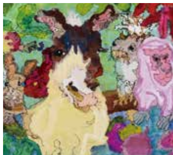
鬼頭 純平 「八天堂のなかまたち」