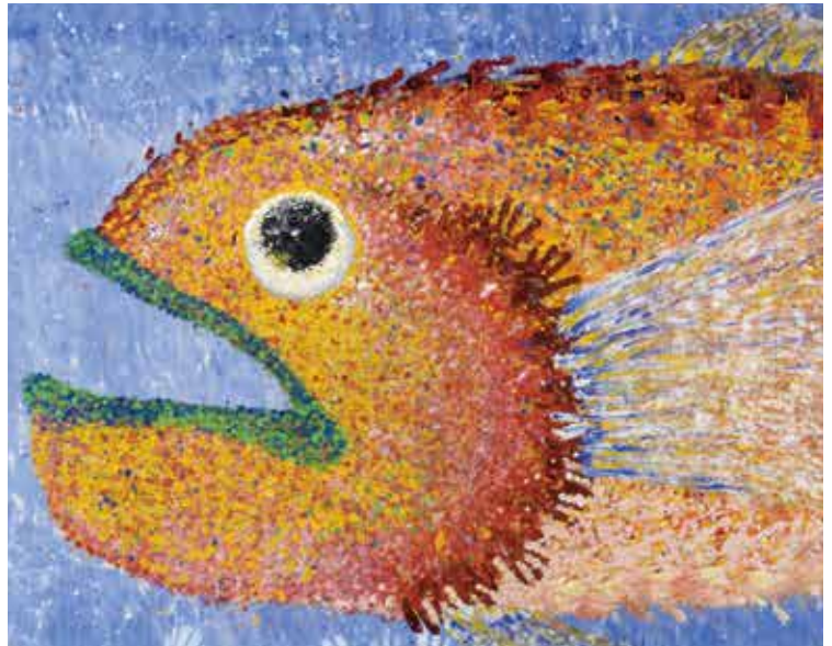
令和元年度 広島県知事賞 「虹の海の主」 あんずの家