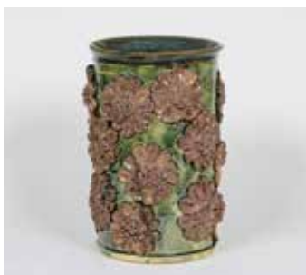
ひまわり洗車場 「ひまわりの輪*和*話*」