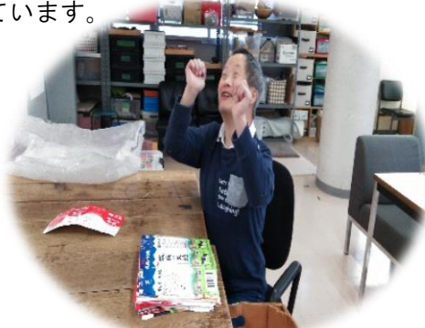
牛乳パックの整理