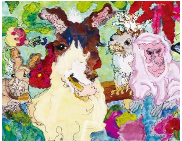
令和2年度 広島県知事賞 「八天堂のなかまたち」 鬼頭 純平