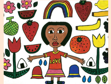
廣田 明日香 「フルーツバスケット」