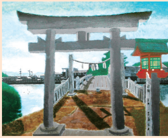
藤井 柁輔 「新市の神社」