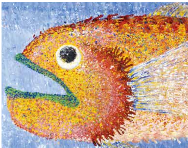
令和元年度 広島県知事賞 「虹の海の主」 あんずの家