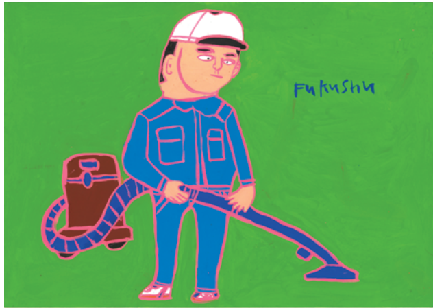
そうじしてるところ