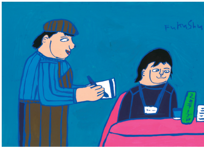
ちゅうもんしてるところ