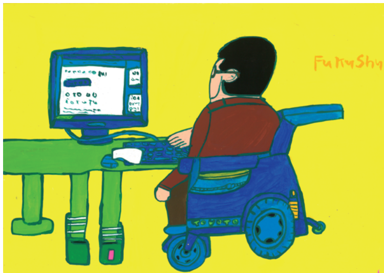
パソコンしてるところ