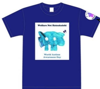
ゆうぞうくんTシャツ