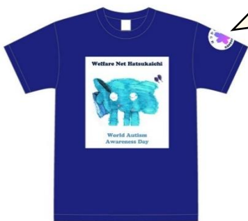
ゆうぞうくんTシャツ